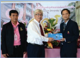
ครบรอบ 17 ปี ศูนย์กีฬา แห่งจุฬาฯ