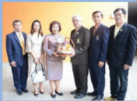
ครบรอบ 56 ปี คณะครุศาสตร์