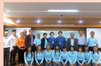
สหกรณ์ออมทรัพย์กรมปศุสัตว์ จำกัด