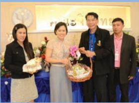
ครบรอบ 17 ปี คณะจิตวิทยา