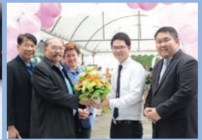
เปิดที่ทำการร้านสหกรณ์ สาขาคณะทันตแพทยศาสตร์