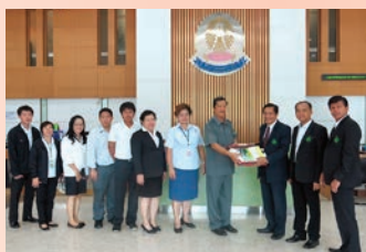
สหกรณ์ออมทรัพย์การสื่อสารแห่งประเทศไทย