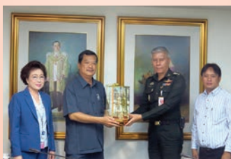
สหกรณ์ออมทรัพย์กองพลทหารปืนใหญ่ จำกัด