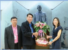
ครบรอบ 48 ปี คณะนิเทศศาสตร์