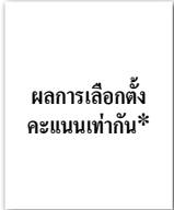
ผู้ประสานงานหน่วยที่ 8