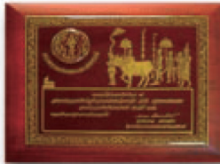
โล่ครั้งที่ 2