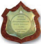
โล่ครั้งที่ 1