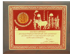
โล่ครั้งที่ 3